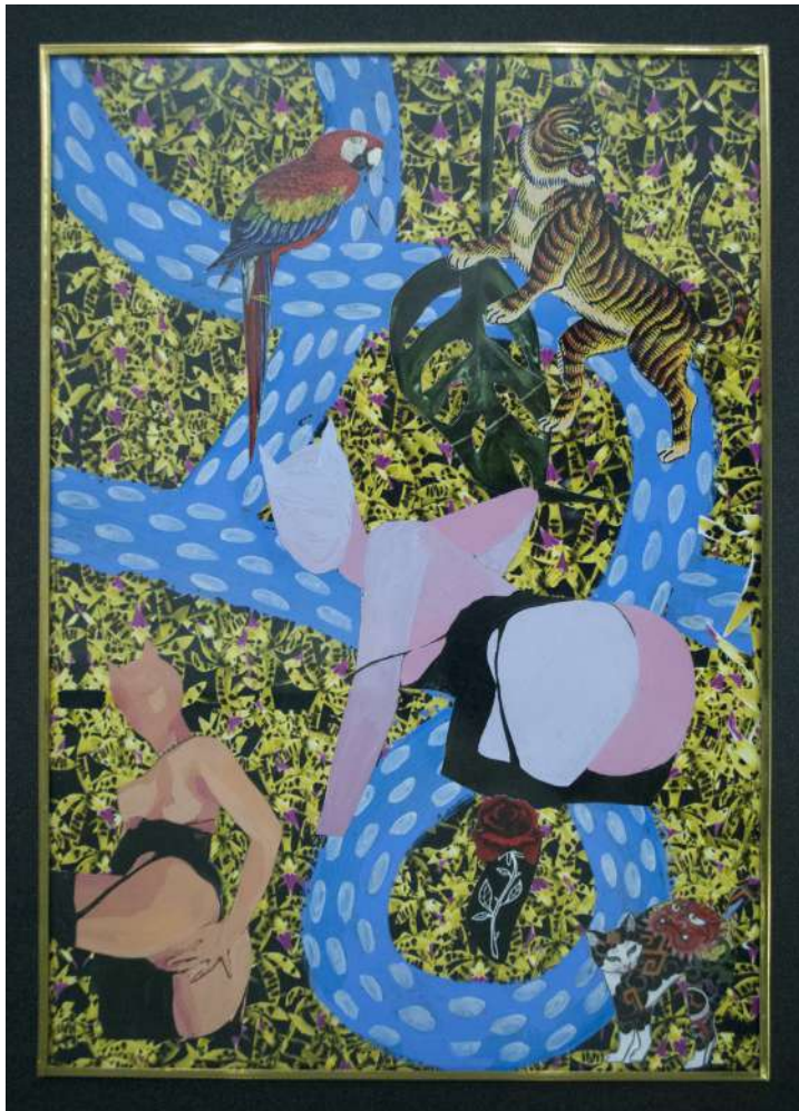
Sin título Daphne Lyon Collage 28 cm x 21 cm 2019 $700.000 pesos colombianos cada una