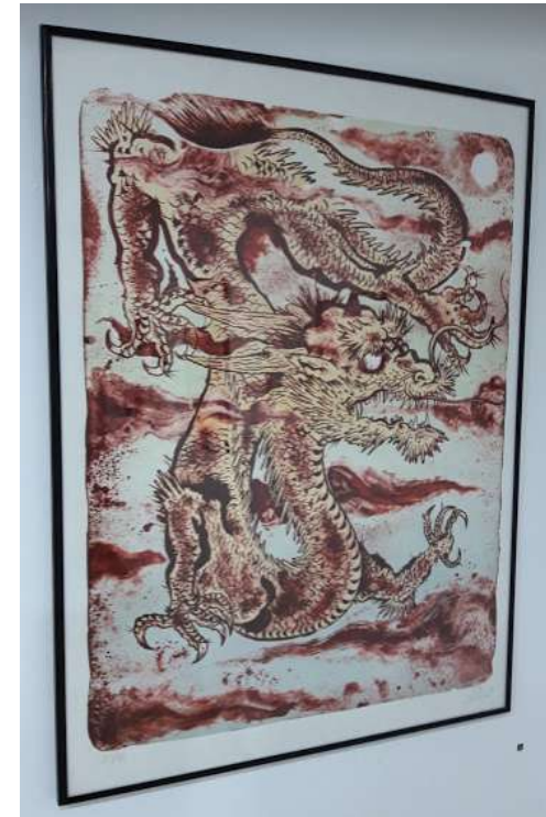
Sin título Dr. Lakra Lithograph 88 cm x 66 cm 2016 $5.000 US Dollars