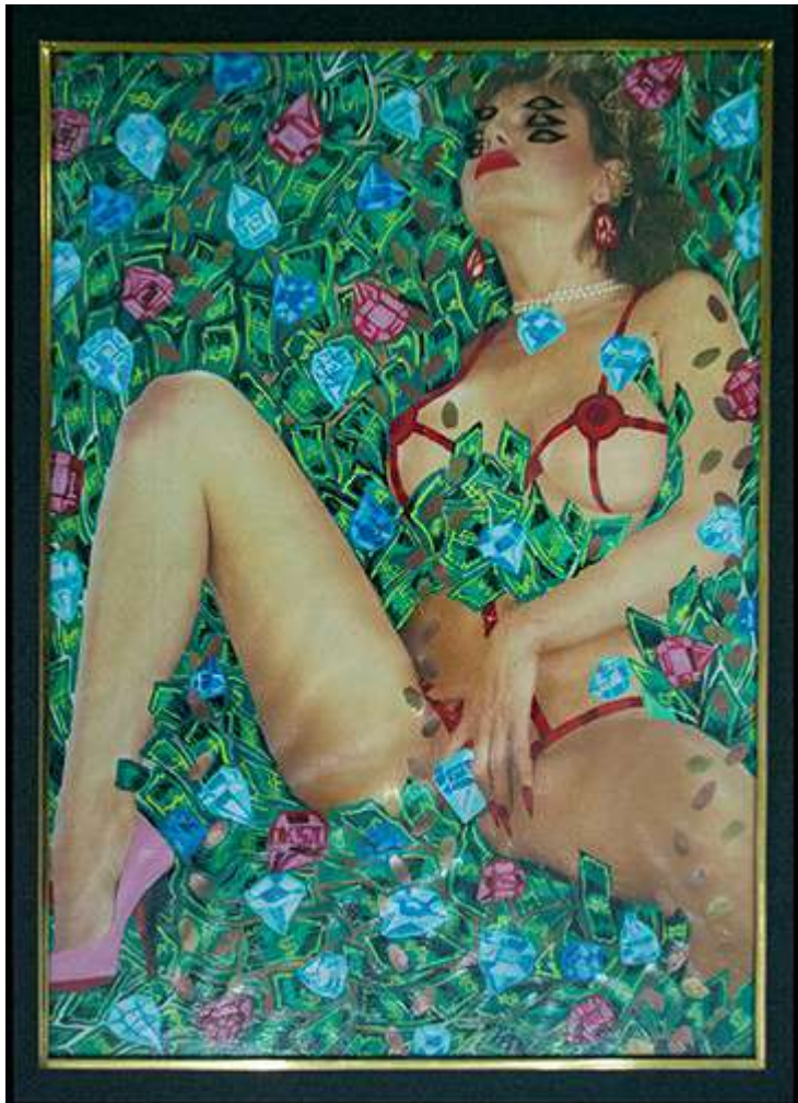
Sin título Daphne Lyon Collage 28 cm x 21 cm 2019 $700.000 pesos colombianos cada una